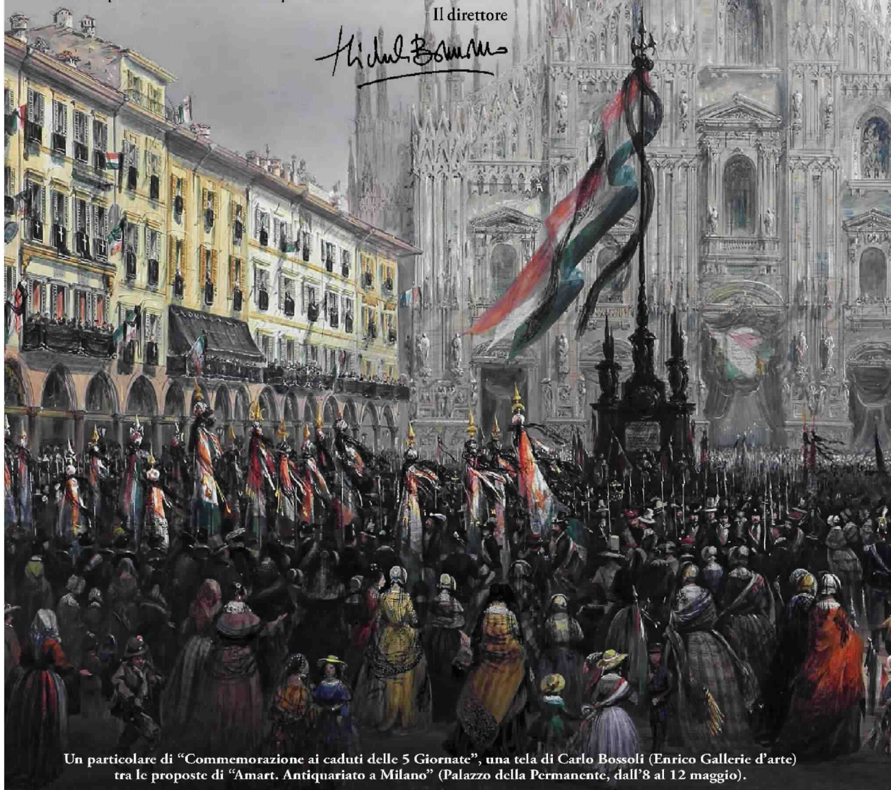
Un particolare di "Commemorazione ai caduti delle 5 Giornate", una tela di Carlo Bossoli (Enrico Gallerie d'arte) tra le proposte di "Amart. Antiquariato a Milano" (Palazzo della Permanente, dall'8 al 12 maggio).